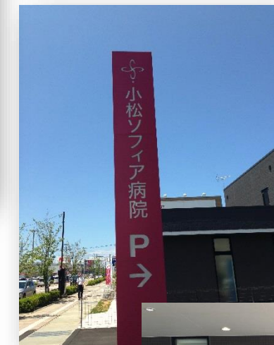
ソフィア病院の 門出の日は、 とても、お天気の 良い1日でした。