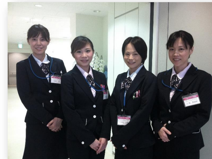
私たちコンシェルジュが、ご案内いたします。

沖町に「小松ソフィア病院」としてスタートし、1ヶ月が経過しました。 新しい診療科 足病科・セラピー外来をスタートし、気持ちを新たに、 より皆様に愛される病院づくりを心掛けております。