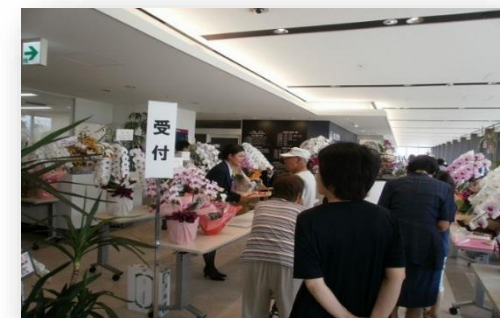
たくさんのお花を頂きました。ありがとうございました。