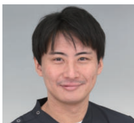
小松ソフィア病院 地域連携部部長 訪問診療統括責任者