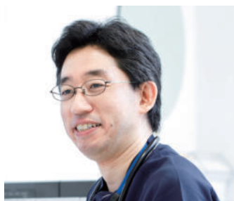
医療法人社団 愛康会 理事長