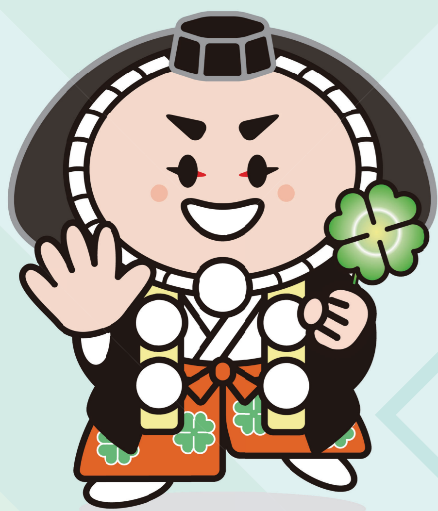
小松市イメージキャラクター カブッキー